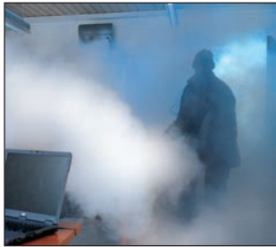
Enkele seconden na de inbraak