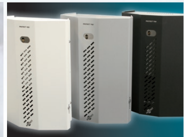
Antisabotage stalen behuizing. Fraai ontwerp in 3 kleuren.