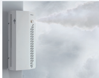
De nieuwe serie is krachtiger dan ooit. De beveiligde ruimte is in enkele seconden gevuld met dichte mist.

's Werelds krachtigste mistkanon is nu in productie. De nieuwe 2200 is ontworpen voor het beveiligen van grote ruimten. PROTECT's serie Pulse Mode gestuurde machines zijn het meest installatie vriendelijk. Het ontwerp zorgt ervoor dat elk onderdeel – zonder demontage van het apparaat zelf – ter plaatse kan worden omgewisseld. De unieke mistvloeistof container kan – zonder geknoei – in seconden worden vervangen!