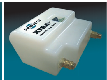
Robuuste container met XTRA+ vloeistof: Extra dichte mist blijft langer hangen.