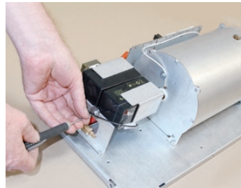
Doordachte componenten opstelling zorgt voor een gemakkelijke toegang tot de diverse onderdelen en spaart tijd en geld.