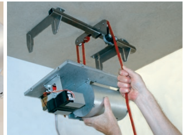
Het installatie hulpstuk helpt bij installatie aan het plafond. Bekijk de demo video op www.ProtectGlobal.com .