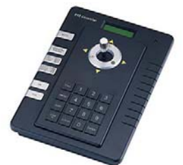
Compact PTZ bediendeel