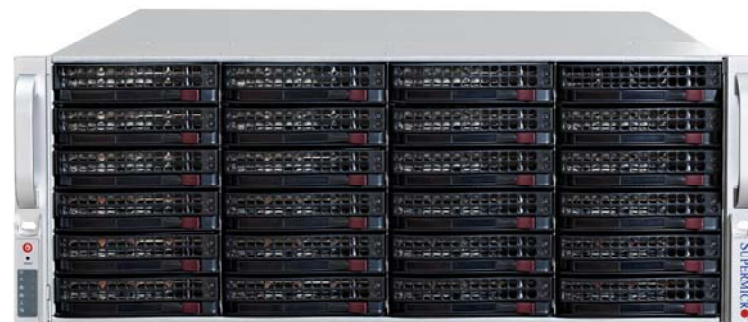
CMX1108: tot 108 camerastreams in 1080p, 3 MP of 5 MP