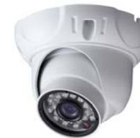
Intelligente IR camera