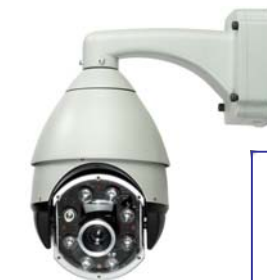
IR speeddome camera