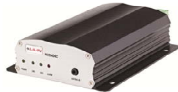
Compacte NVR met Touch interface

Deze camera beschikt tevens over een EN50155 certificering en is daarmee geschikt voor gebruik in het openbaar vervoer. Hiervoor is tevens een speciale mobiele recorder, met Touch interface, ontwikkeld voor 4 IP (Megapixel) camera's.