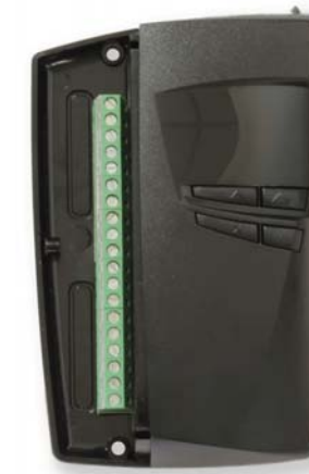
De nieuwe Flexiscan controller

we—en beveiligde - seriële bus, die ervoor zorgt dat externe apparatuur zoals lezers, in/output modules en RF ontvangers, op maximaal 150 meter vanaf de Flexiscan controller kunnen worden geplaatst via de S-bus. S-bus is een eigen ontwikkeling van Impro Technologies en zorgt ervoor dat de nadelen van Wiegand (niet beveiligd en meer-draads) tot het verleden behoren.