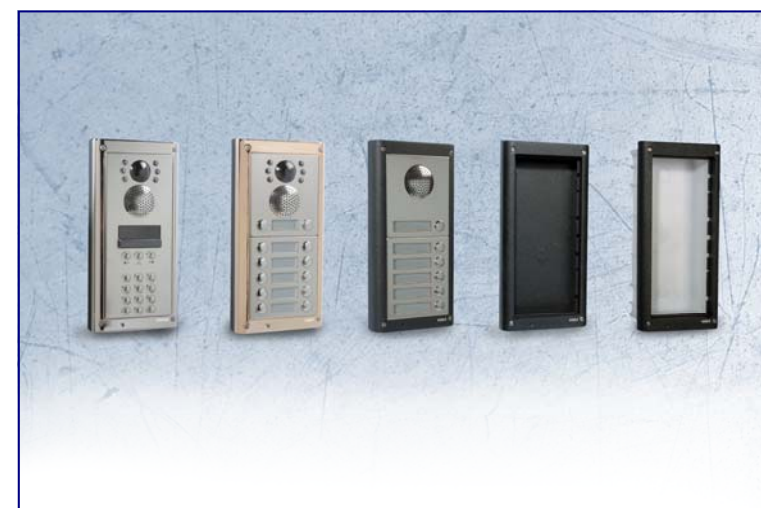
4000 serie buitenposten

De recent geïntroduceerde 6000 serie wandtoestellen is uiterst compact vormgegeven en beschikken over een helder 2,4" TFT kleuren matrix beeldscherm. In eerste instantie ontworpen voor de digitale systemen VX2200 en VX2300, zijn deze toestellen nu ook verkrijgbaar voor 6-draads bus en 4+1 systemen. Tevens worden deze toestellen ook in de nieuwe 6000 serie 2-draads kits gebruikt.