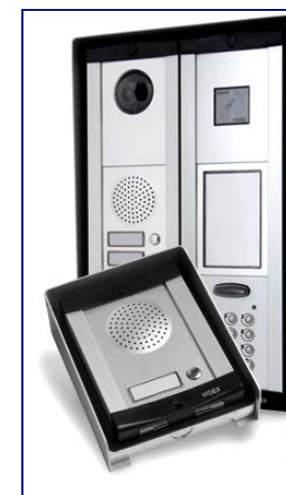
8000 serie buitenposten

Als opvolger van de destijds zeer populaire 800 serie heeft VIDEX een vervangende serie geproduceerd. Deze serie—de 8000—is geschikt als vervanging voor de oudere typen en heeft in de meeste gevallen zelfs dezelfde aansluitingen om een overgang naar de nieuwe modellen te vergemakkelijken. De nieuwe modellen hebben een verbeterde weersbestendigheid en elektronica, zodat een storingsvrije werking, ook onder lastige omstandigheden, gewaarborgd is. De 8000 serie modules passen in de oude 800 behuizingen.