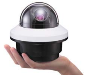
Kleinste speeddome in ons pakket