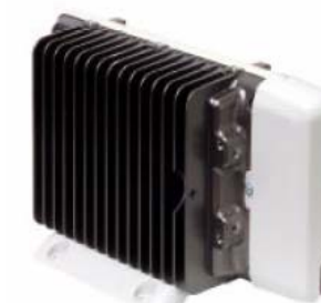
Eclipse Dedicated Recorder

op het 'live' beeld nu ook mogelijk maakt op het opgeslagen beeld. Zie voor een uitgebreide beschrijving van dit bijzondere product het betreffende informatieblad. De camera kan worden geprogrammeerd (of permanent worden bediend) met het standaard Vista bediendeel.