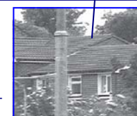
Op 177 meter afstand

pixel camera zoal kan (zie het onderdeel IQEye op