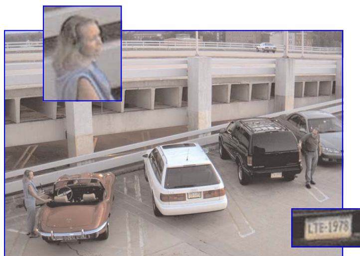
IQeye501 totaalbeeld met details

De camera is snel en kan tot 30 beelden per seconde in D1 resolutie overdragen en tot 20 beelden in HDTV resolutie. De camera is ontworpen voor professioneel gebruik en is dus niet weer het zoveelste plastic 'doosje met een chipcamera'. Daarvoor hebben wij