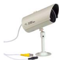
Bullet dag/nacht met mechanisch filter