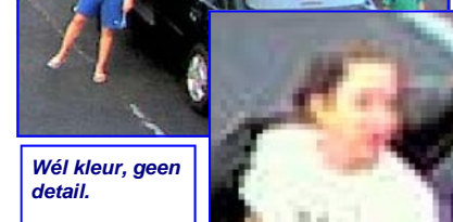
Wél kleur, geen detail.