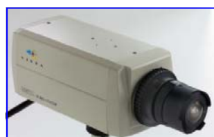
Dag/nacht met mechanisch filter