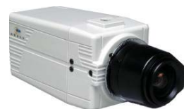
Vista Compact serie

Vista heeft recent een aantal interessante producten toegevoegd aan haar reeds bestaande indrukwekkende reeks camera's. Allereerst zijn daar de compacte camera's, die vooral bedoeld zijn als antwoord op de vele 'catalogus' aanbiedingen en derhalve uiterst concurrerend zijn geprijsd. Daarnaast is er de PowerDome Lite, een kleinere versie van de bekende PowerDome. De PowerDome Lite is geschikt voor buitengebruik (IP66). Ook nieuw is de bullet dag/nacht serie camera's die met een mechanisch filter en 18 IR LED's zorgt voor een (kleuren) beeld overdag en een scherp (zwart/wit) beeld wanneer de lichtomstandigheden onvoldoende zijn voor een kleurenbeeld.