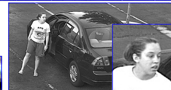
Geén kleur, wél detail. Ondanks dat we deze opname gemaakt hebben met een 3 Megapixel kleuren camera, kan zo'n camera niet tippen aan de resultaten die te bereiken zijn met een SentryScope™.