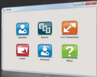
IXP20 HOOFDMENU VAN DE WEB INTERFACE