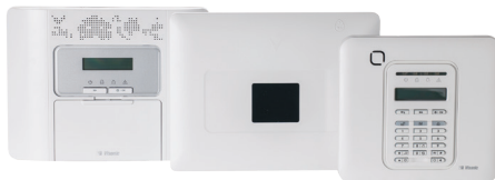
PowerMaster-10 PG2 30-zone alarmsysteem