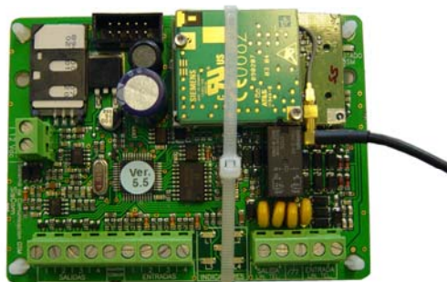
Alpha GSM losse print (004496)

Universeel toepasbare GSM kiezer met uitstekende toepassingsmogelijkheden