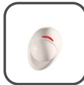
Draadloze Next K9-85 diervriendelijke pir detector (voor huisdieren t/m 38 kg)