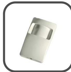
Draadloze K-940 MCW pir detector (voor huisdieren t/m 18 kg)