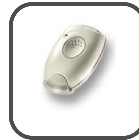
MCT-241 waterdichte paniekzender met man-down melding