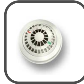
Draadloze MCT-440 gas melder (nog niet leverbaar)