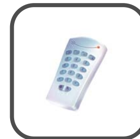
MCT-237 2-weg keyfob handzender voor de PowerMax Pro centrale