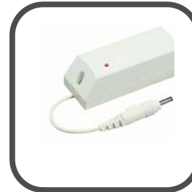
Draadloze MCT-560 temperatuur sensor (nog niet leverbaar)