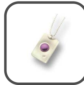
MCT-211 spatwater- dichte polszender