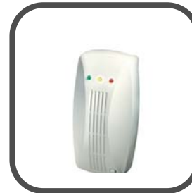
Draadloze MCT-442 koolmonoxide melder