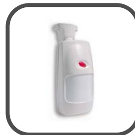
Draadloze Discovery K-980 pir detector (voor huisdieren t/m 36 kg)