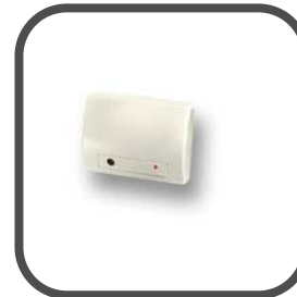
Draadloze water management kit voor afsluiting watertoevoer bij detectie van waterlekage